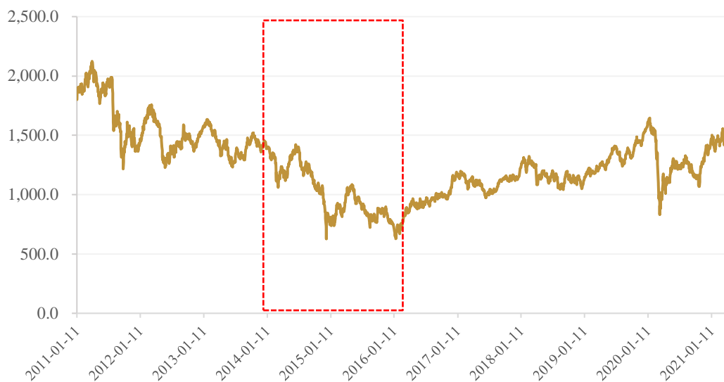
图 3: 2011 年至今俄罗斯 RTS 股指走势 (单位: 点)

2020 年，受新冠肺炎疫情影响，俄罗斯股指于 2020 年 3 月再次大幅下跌。本次美国经济制裁措施暂未对俄罗斯股市形成显著影响，4 月 15 日，俄罗斯 RTS 股指收于 1474.85 点，小幅收跌 1.02% 或 15.15 点。