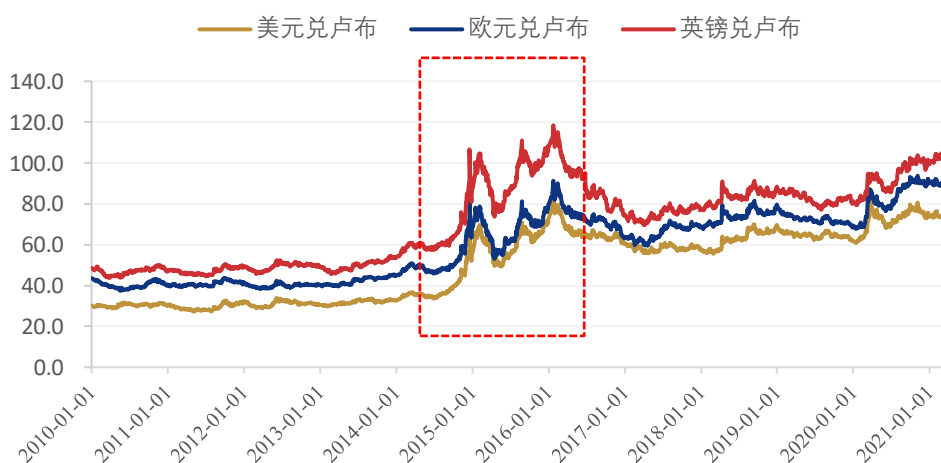
图2: 2010年至今俄罗斯汇率

2021年, 随着美国经济持续回暖, 美元指数持续走高, 将吸引大量资金流入美国, 进而导致新兴经济体资金外流。受通胀上升压力增加, 本国货币大幅承压等多种因素影响, 俄罗斯央行于3月19日宣布将基准利率上调25个基点至4.50%, 因此预计俄罗斯本币将持续贬值趋势, 但不会出现急剧下跌。