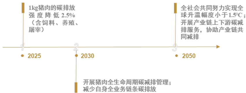
图2 牧原股份转型目标路线图